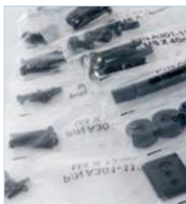
Отсортированные крепежные элементы для скорости инсталляции

Открытая пластина обеспечивает легкий доступ к проводам